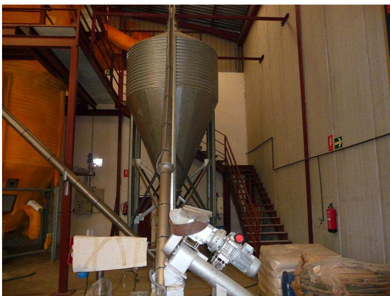
LINEA DE ENVASADO