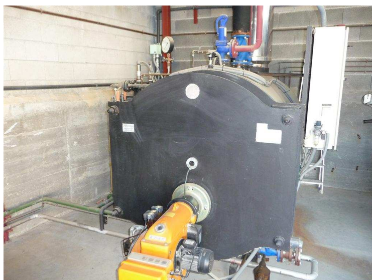
CALDERA DE VAPOR 1100 K/H