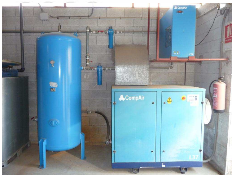
COMPRESOR DE TORNILLO 6000 L/M