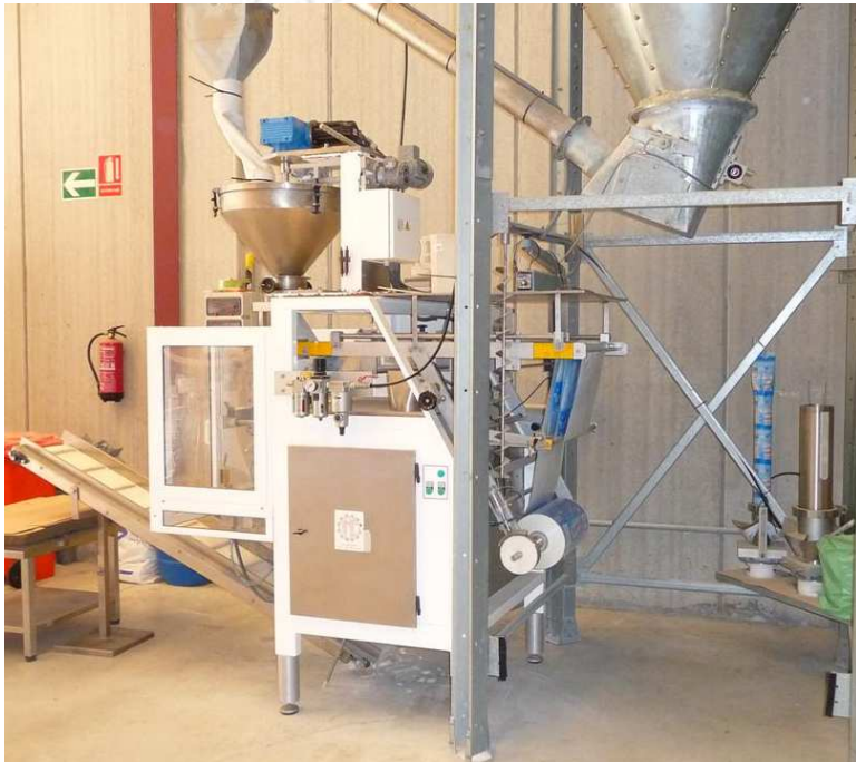
MAQUINA DE ENVASADO